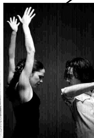
Proyecto "Escena" Gob. de Navarra. "Escena" Proiektua. Nafarroako Gobernuak.

Producción/ Produzioa: Marco Vargas y Chloé Brulé Distribución/Distribuzioa: Elena Carrascal Danza